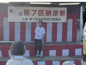
笠懸町第七区の納涼祭 2023.8.1