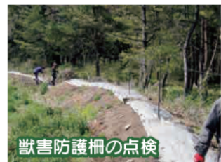
獣害防護柵の点検